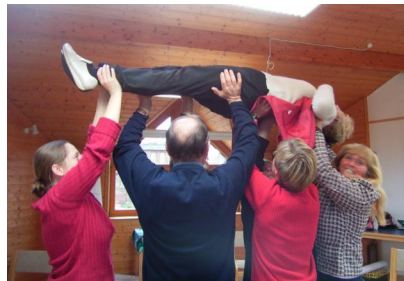
Mit Freude lernen – ein Leben lang

Unsere Veranstaltungen haben Erlebnischarakter und begeistern durch Einzigartigkeit, Einfachheit, Lebendigkeit und Nachhaltigkeit. Unsere individuelle Komposition von Information und Unterhaltung, Ambiente und Methode hinterlässt bleibende Eindrücke mit positivem Erinnerungswert.